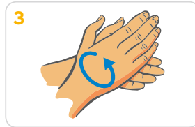
3 Handflächen aneinander reiben, bis sich Schaum bildet. Danach die Hände gründlich waschen.