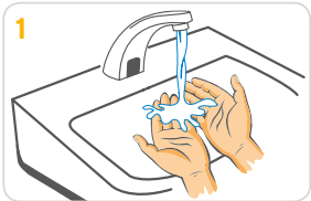
1 Hände mit Wasser anfeuchten.