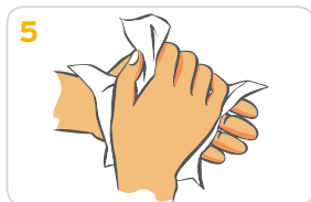
5 Hände gründlich mit einem Wegwerfhandtuch abtrocknen.