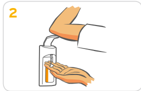
2 1-2 Pumpstöße auf eine Handfläche geben.