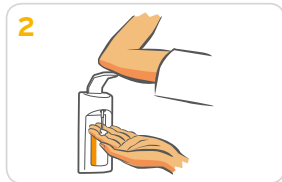
1-2 Pumpstöße auf eine Handfläche geben.