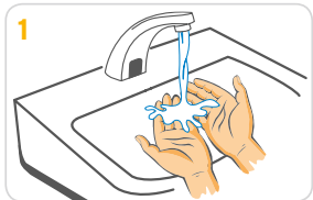
Hände mit Wasser anfeuchten.