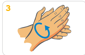
Handflächen aneinander reiben, bis sich Schaum bildet. Danach die Hände gründlich waschen.