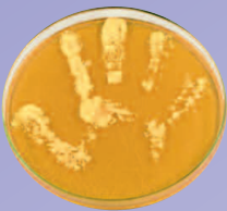
Handabklatsch ohne Seifenwaschung oder Desinfektion

Mit ihrer „Clean Care is Safer Care“-Initiative startete die WHO 2005 eine weltweite Kampagne für mehr Patientensicherheit. Im Mittelpunkt steht die Verbesserung der Händedesinfektion, da diese einen direkten Einfluss auf die Übertragung pathogener Erreger hat. Für dieses Ziel wurde das Konzept der „5 Momente der Händedesinfektion“ entwickelt (1).